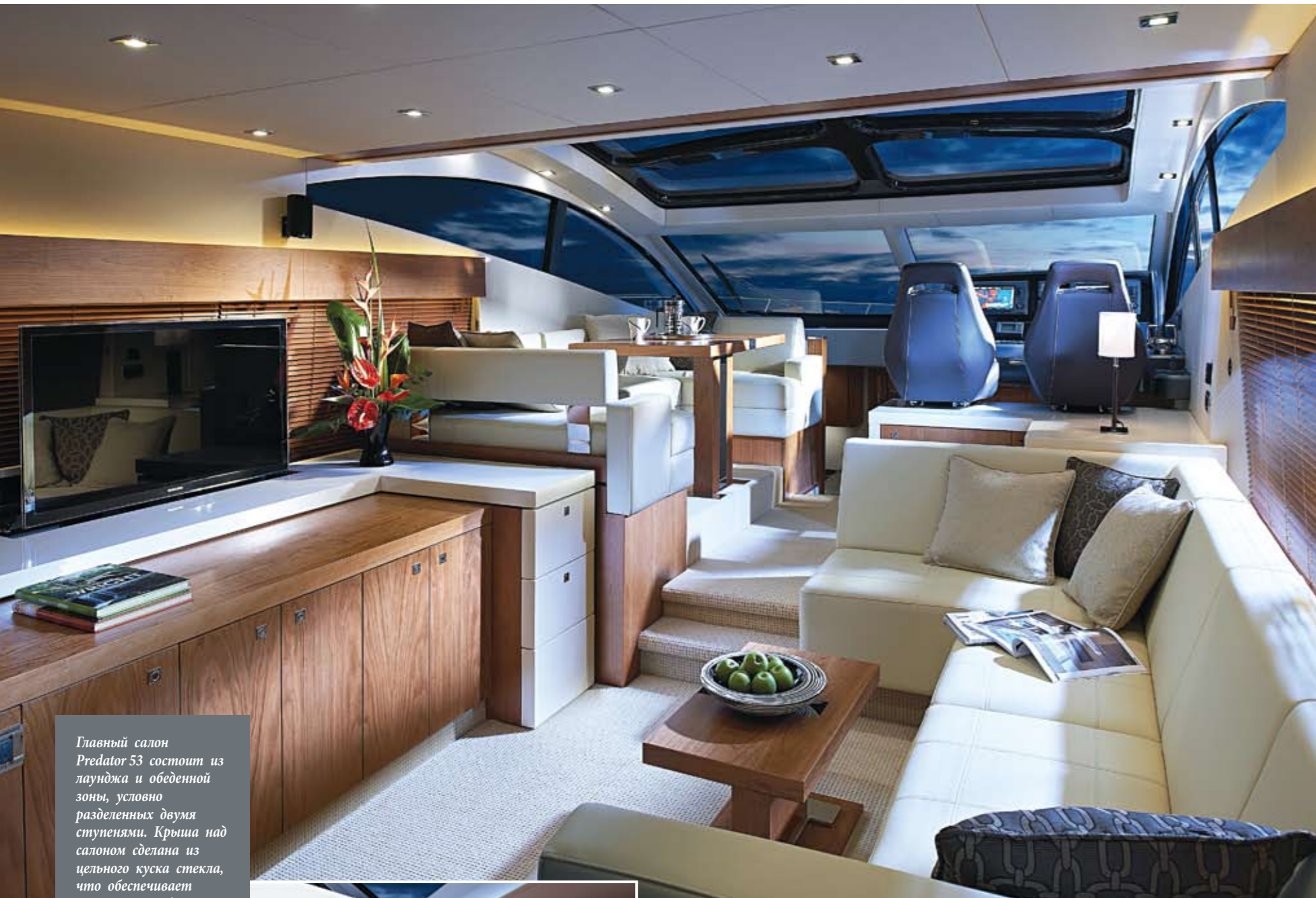
Главный салон Predator 53 состоит из лаунджа и обеденной зоны, условно разделенных двумя ступенями. Крыша над салоном сделана из цельного куска стекла, что обеспечивает прекрасный вид