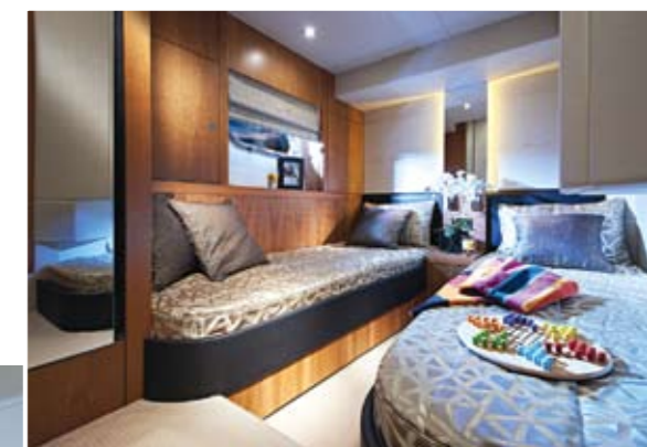
На нижней палубе имеются три вместительные каюты, здесь же оборудован функциональный камбуз